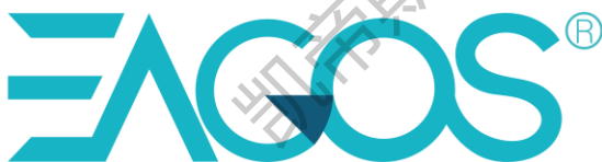
标识六（易歌石公司）

EAGOS 字母变体，长宽比为 3.95:1，易歌石三个字长宽比为 4.06:1，总体长宽比为 2.05:1